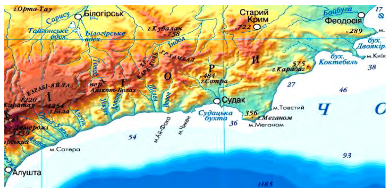
Рис.3. Обзорная карта Юго-Восточного Крыма

Данная территория в течение четвертичного периода в меньшей степени подвергалась опусканиям, и поэтому на суше сохранился ряд участков высоких морских и речных террас. Соответственно существенные отличия имеются в характере покровных отложений. Здесь полностью отсутствуют массандровские отложения, меньшее распространение и мощность имеют оползневые накопления. Широко распространены элювиально-делювиальные отложения, представленные, как правило, желто-бурыми или серо-бурыми суглинками с мелкой щебенкой аргиллитов и алевролитов и обломками песчаников. Современные эрозионные процессы, и наличие древних речных террас обуславливает значительное распространение аллювиальных и пролювиальных отложений: гальки, суглинков, гравия, щебня.