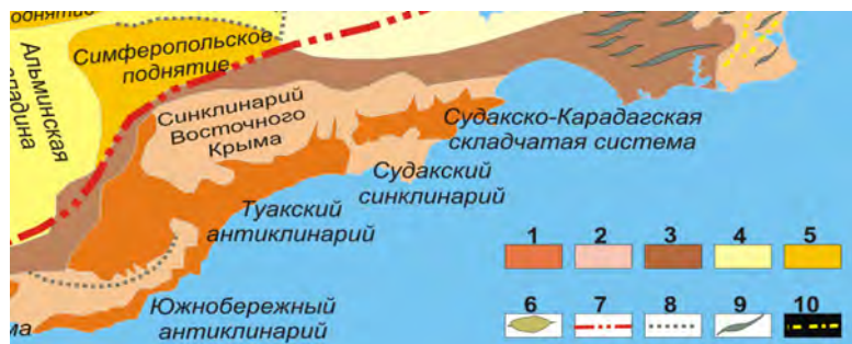
Рис. 2. Схема геологического строения Крыма (по М.В.Муратову, с изменениями)

до 15 км). В тектоническом отношении она располагается в пределах Туакского антиклинория, а в северо-восточной части также Судакского синклинория (рис. 2). Коренные породы представлены триасовыми и юрскими отложениями.