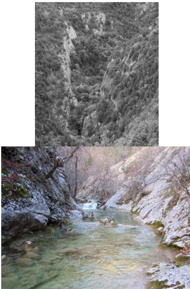
Рис. 1. Узунджинский каньон: а) общий вид; б) наиболее узкая часть каньона

Этому способствует и подстиание данных пород более податливой слоистой толщей. На их контакте в бортах долины возникают небольшие денудационные полости, усиливающие и отделение блоков известняков, и их отседание.