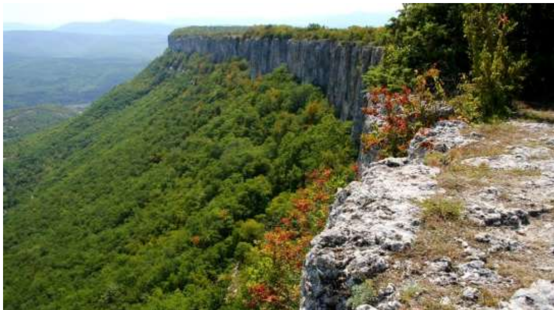
Рис. 3. Отвесные обрывы горного массива Кыз-Кермен

особенности на западной окраине плато. Геологические условия развития вертикальных уступов одинаковые на всем протяжении горного массива.