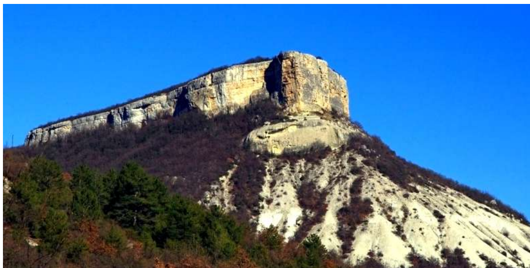
Рис. 1. Горный массив Кыз-Кермен

Кыз-Кермен – это столовый мыс предгорной части Юго-Западного Крыма. Представляет собой южный отрог крупного столового массива Чуфут-Кале. Вытянут в меридиональном направлении с юга на север на 3,5 км при ширине 120–600 м, высота 454–472 м. Общая форма – вытянутый прямоугольник (рис. 1). На юге заканчивается второстепенным клинообразным мысом Хулен-Бурун. С запада ограничен узкой глубокой долиной Кая-Арасы, а с востока – узкой долиной Безымянной. Обе долины открываются в широкую долину реки Качи.