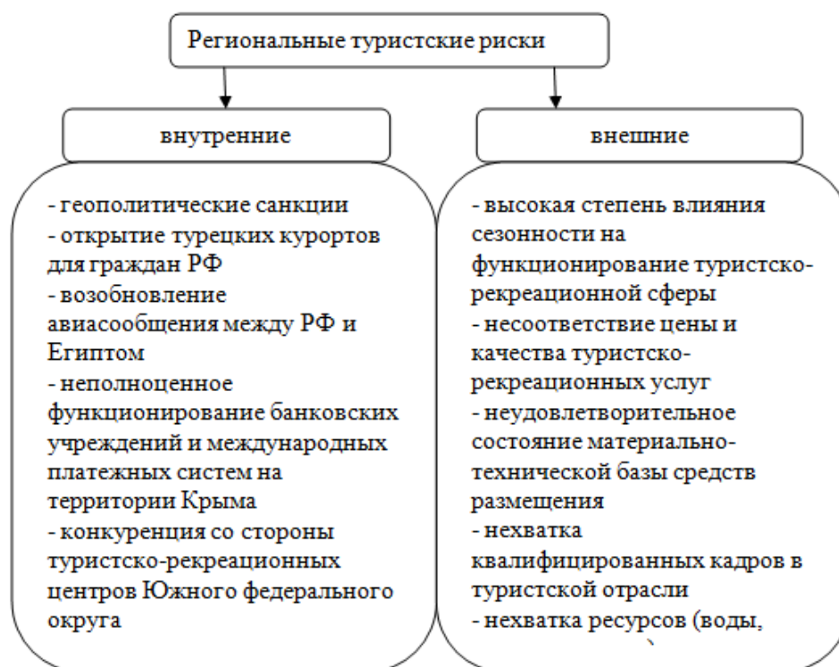
Рис. 1. Ключевые риски развития туристской сферы в Крыму. Составлено авторами.

По данным Крымстата, количество прибывших иностранных туристов в Крым в 2013 г. составило 2, 64 млн. чел., а в 2017 году, уже после введения санкций, лишь более 500 тыс. чел. Большая часть экспертов оценила данный риск как фактор, имеющий довольно высокую степень влияния на туристскую отрасль Крыма, присвоив от 5 до 10 баллов. Средний балл составил 7,73.