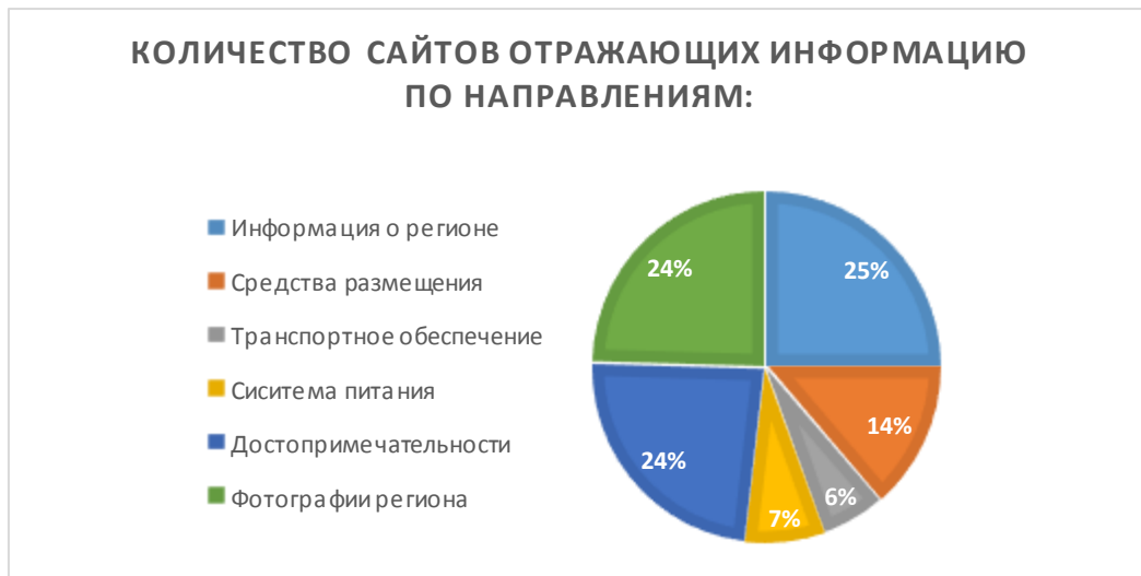
Рис.1. Основные информационные разделы сайтов туриндустрии субъектов СКФО

Из 70 анализируемых сайтов туриндустрии субъектов СКФО, стоит отметить наличие на большинстве из них общей информации о регионах (25%), наиболее полной информации достопримечательностях на 24% сайтов, обеспеченность сайтов (24%) фотографиями туристических объектов, рисунками, схемами маршрутов из которых складывается туристический образ рассматриваемого региона. Характеристику средств размещения отражают лишь 14% сайтов, характеристику объектов питания только 7% сайтов, наименьшее число сайтов (6%) содержат информацию о транспортном обеспечении (рис.1).