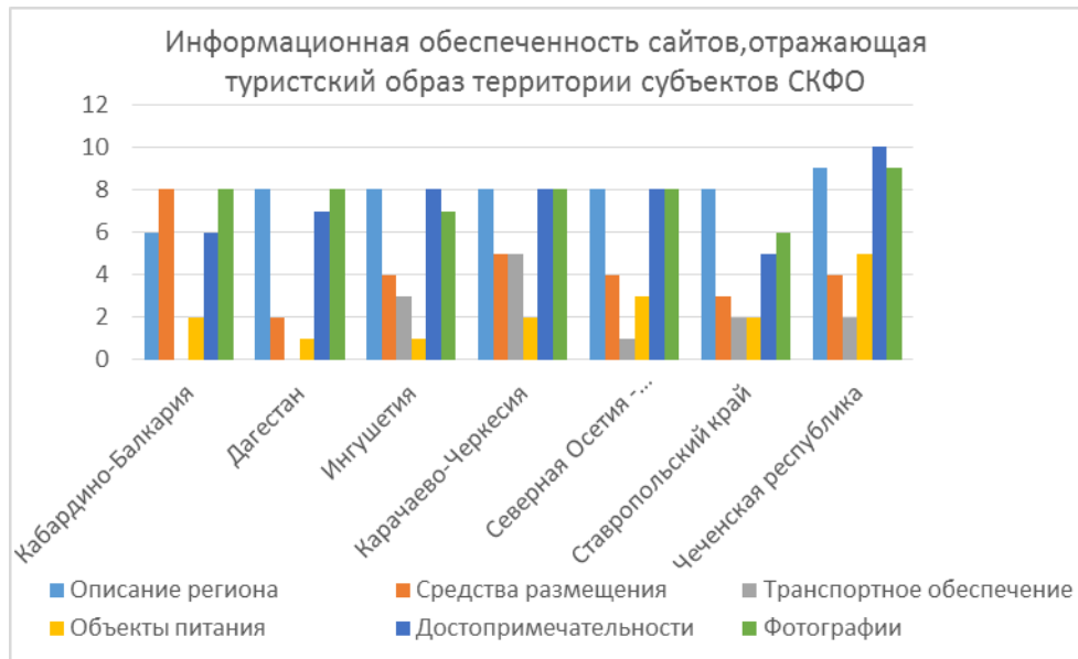
Рис 2. Оценка информационной обеспеченности сайтов, отражающих туристских образ территории, субъектов Северо-Кавказского федерального округа

Некоторые сайты не несут совершенно никакой значимой информации для потенциальных туристов, оценка содержательной стороны сайтов составляет от 2 до 5 баллов (МК.ги, республика Дагестан [14], «Туту.ру», Карачаево – Черкесская республика [15], «Большая страна», республика Северная Осетия – Алания [16], «Альпика-Тур 26», Ставропольский край [17] (рис.2).