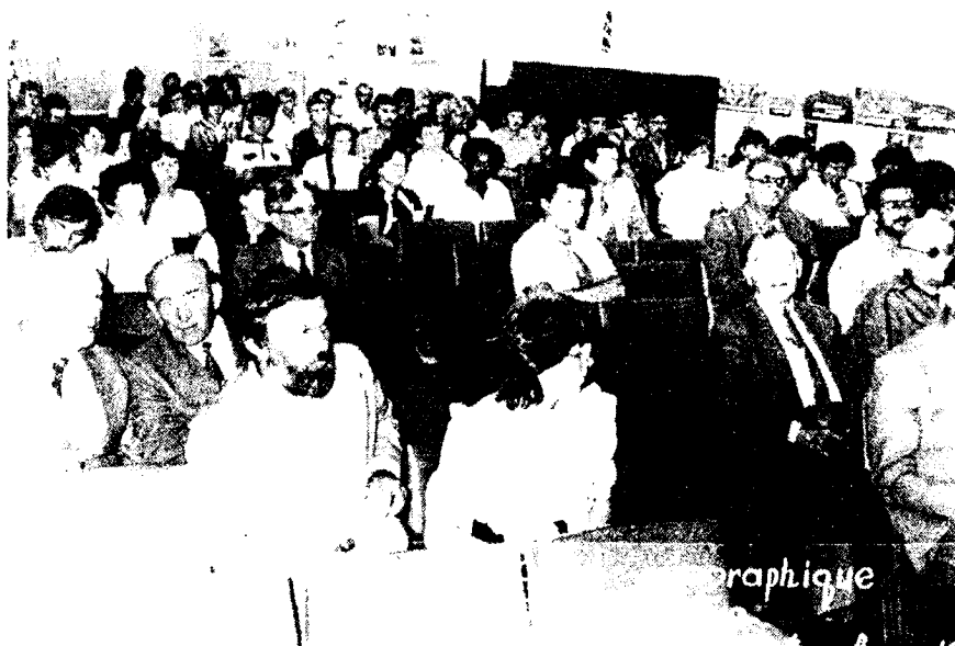
Рис. 6. В зале заседания пленарного заседания географического советско-французского симпозиума. Симферополь, 1984 г.