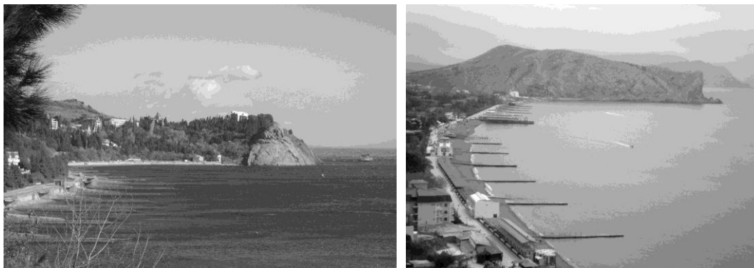
Рис. 2. Береговая зона Южнобережья: слева – мыс Плака, справа – Судакская бухта и мыс Алчак.

30–45 м (в урочище Карасан и у с. Веселое Судакского района) [17]. Абразионные уступы представлены у с. Морское и в устье р. Ускут.