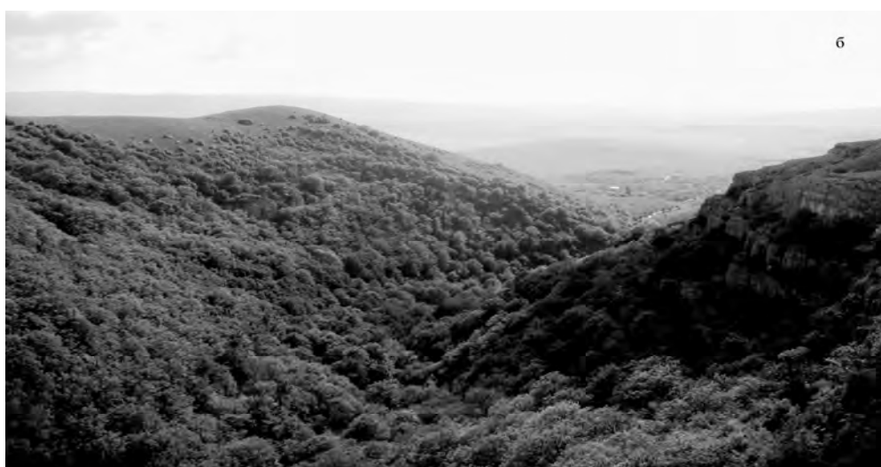
Рис. 1. Симметричный (а) и асимметричный (б) отрезки долины р. Малый Салгир.

В средней части исследуемой долины ее направление является северо-западным и существенно не изменяется. Постоянным остается и значение крутизны продольного профиля ( 4\text{--}6^\circ ). Русло в плане очень полого извилистое, днище узкое.