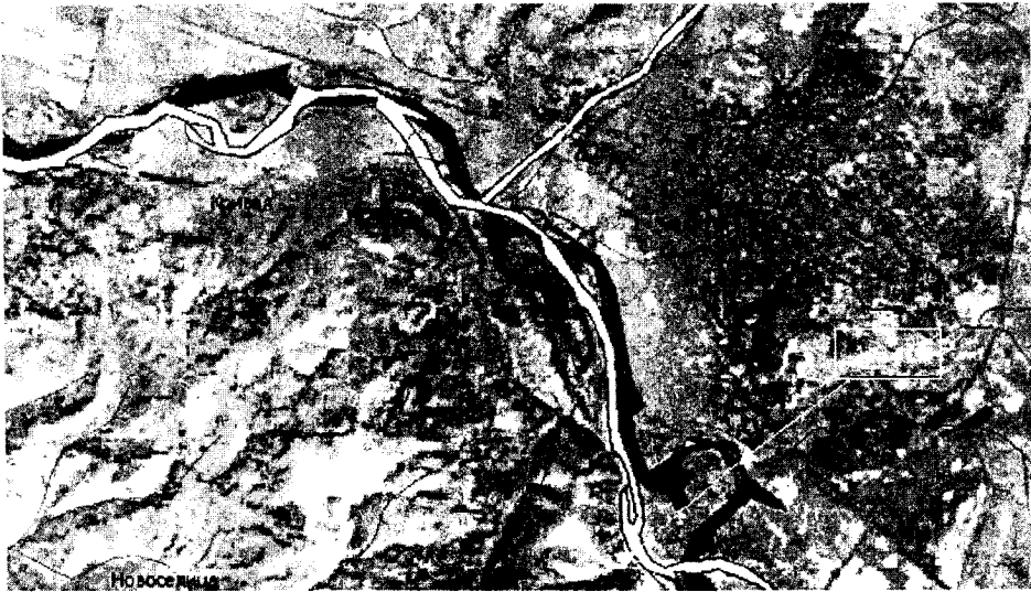
Рис. 2. Зміни геометрії русла р. Тиса за даними: а) існуючої базової електронної карти України м-бу 1:200 000 з фонду УІАС НС (темний контур). б) дешифрування космічного знімку Landsat 7 ETM+ (2001) року (світлий контур).

Актуалізований матеріал передано у МЦЕК (м. Харків) для оцінки якості актуалізації та розміщення у фонді тематичних електронних карт УІАС НС.