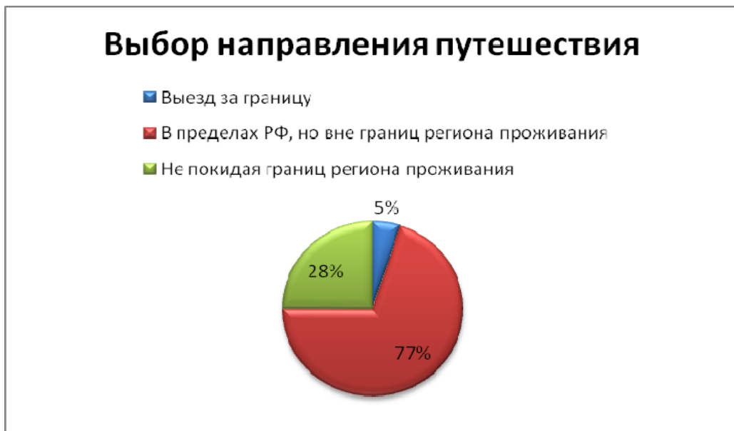
Рис. 2. Предпочтительные направления туризма.

Предпочтение заграничного отдыха объясняется респондентами как экономически выгодное предложение. Отдых внутри региона (помимо дешевизны) привлекает местными, хорошо изученными туристскими дестинациями (50 % отдыхающих в пределах Оренбургской области предпочли внутренний туризм, так как давно мечтали посетить какое-либо место, вне зависимости от ценовой политики).