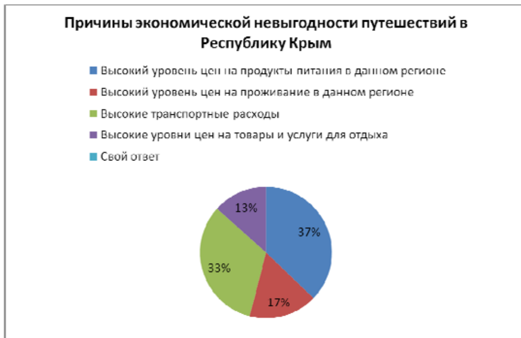
Рис. 4. Причины экономической невыгодности путешествий в Республику Крым.

На основании проведенного исследования можно сделать следующие выводы о молодежном туризме Оренбургской области в целом и в крымском направлении в частности: