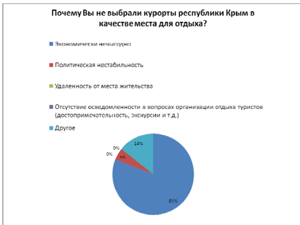
Рис. 3. Причины отказов от путешествий в Республику Крым.

Наиболее весомой причиной отказа стали экономические опасения туристов. Соотношение экономических рисков по мнению респондентов отражено в таблице 4.