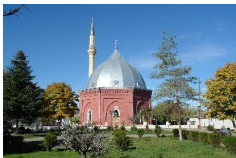
Рис. 1. Джума мечеть

Вторая по величине синагога в поселке Красная Слобода «Гилаки» была сооружена в 1895 г. выходцами из Гиляна, провинции Южного Азербайджана. Религиозное сооружение, спроектированное Гигелем бен Хаими, привлекает внимание туристов своим уникальным внешним видом. Особую красоту синагогу Гилаки придает узкий шестиугольный купол, построенный на четырехколонной крыше. Здание синагога имеет 12 окон в соответствии с количеством ветвей Израиля (рис. 4).