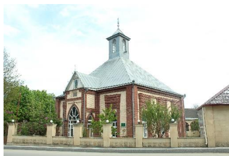
Рис. 2. Мечеть Сакина Ханым